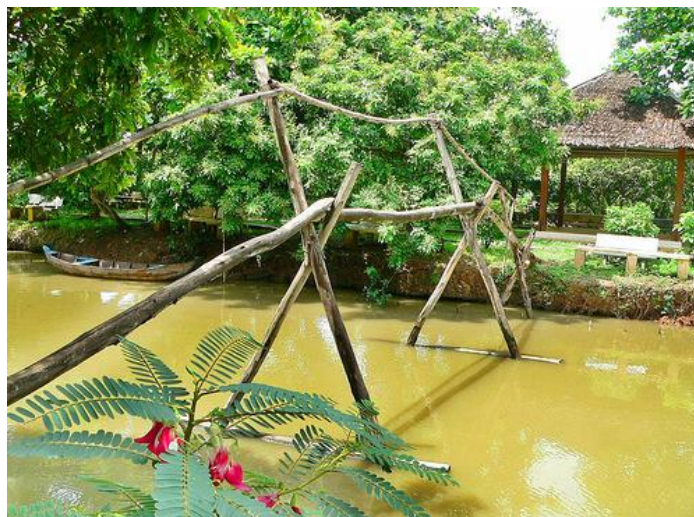
Câu-khi : Pont aux singes

Dans le hameau de Phung-Thanh, les pouvoirs publics n'ont pas les moyens pour construire une école. L'école publique la plus proche pour certaines zones est à 10km. Il n'y a qu'une seule route qui traverse une partie de la région. Pour ceux qui habitent loin de celle-ci, il leur est impossible d'atteindre l'école en vélo à cause des embûches naturelles que représentent les ponts aux singes (câu khi) sur leur passage.